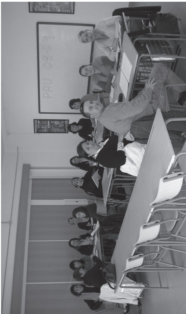
Éstos también son pioneros. Están muy cerca de la Universidad. PAU, 2008-09