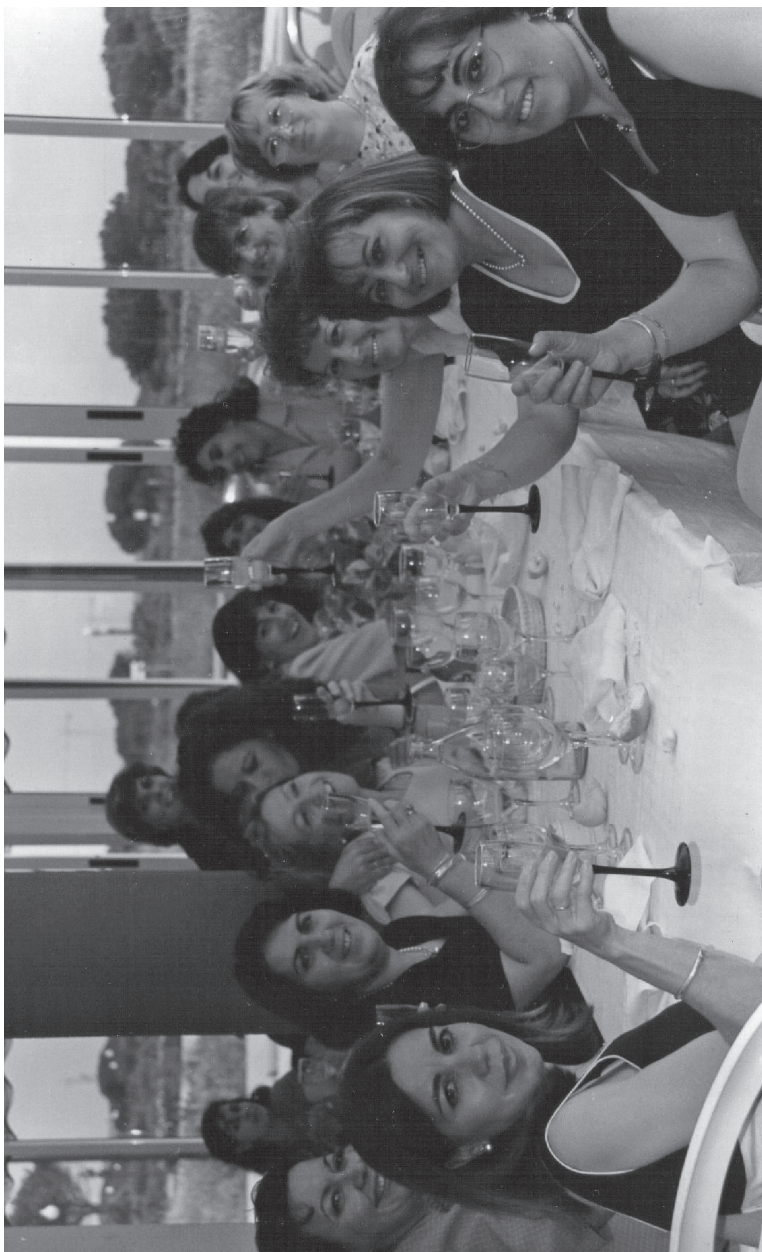
Grupo de alumnas del curso MAREP, 1995