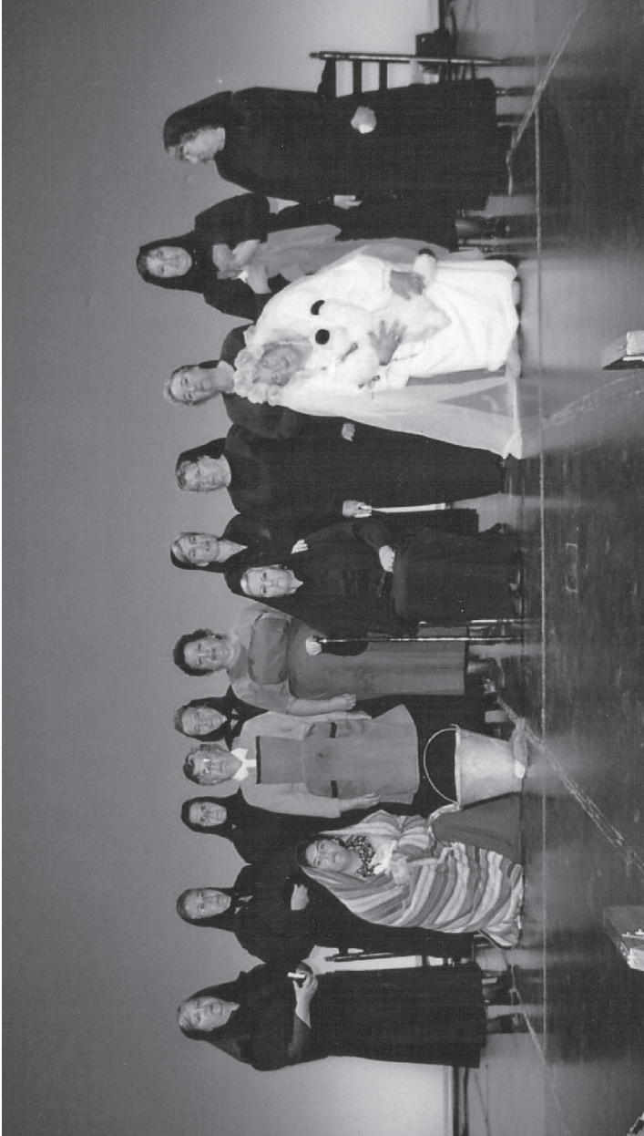
ALUMNAS DEL CENTRO DE ADULTOS DE CHICLANA PRESENTAN "LA CASA DE BERNARDA ALBA" (Obra de Federico García Lorca) abril, 2003