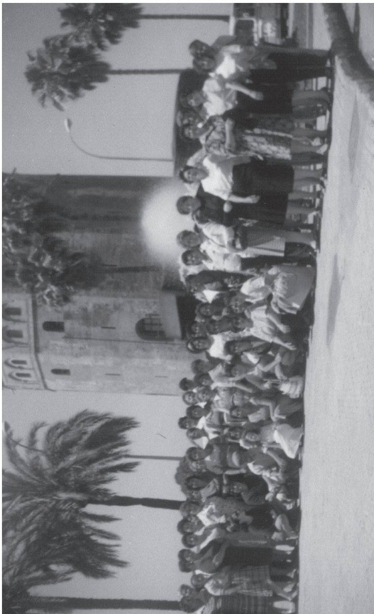
Los pioneros. Primero excursión, Sevilla, 1985